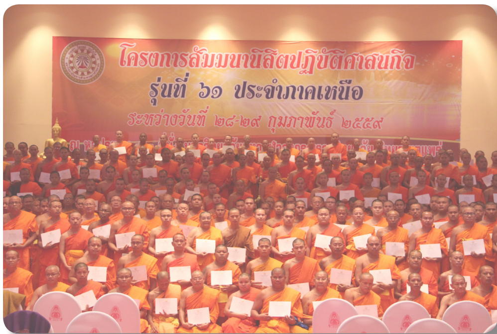
ภาพกิจกรรมสัมมนาพุทธศาสนบัณฑิต ๔ ภาค