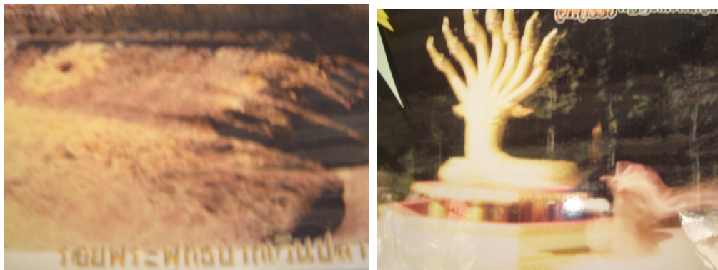
ภาพที่ ๑๔ - ๑๕ ภาพรอยพระพุทธบาทเวินปลา กับภาพที่ช่างภาพถ่ายได้ในพิธีบวงสรวง พญานาคเห็นเป็นเจตสิกของพญานาคกำลังเลื้อยมาที่รูปปั้นพญานาค ที่ทางวัดได้สร้างและอัญเชิญพญานาคให้มาสิงสถิต

“...แต่นั้นพระพุทธเจ้าก็เสด็จไปเมืองศรีโคตรบอง ถึงที่อยู่ของพญาปลาตัวหนึ่ง พญาปลานั้นเห็นพระรัศมีของพระพุทธเจ้าจึงพาบริวารล่องลอยตามไป พระพุทธองค์เห็น เหตุการณ์ ดั่งนั้นจึงทรงแยมพระโอษฐ์เจ้าอาณนทัตถุถามเหตุแห่งการแยมนั้น แล้วพระองค์ จึงได้ตรัสว่า ตถาคตเห็นพญาปลาตัวหนึ่งพาบริวารตามมาถึงฝั่งน้ำที่นี่ ปลาตัวนี้แต่ก่อน เป็นมนุษย์ ได้บวชในศาสนาของพระกัสสปพุทธเจ้า ได้มาถึงแม่น้ำที่นี้ภิกษุนี้ไม่ได้เค็ดใบไม้ รongน้ำฉันบได้แสดงอาบัติ ครั้งใกล้จตุได้มีความกินแห่งถึงกรรมที่ได้ทำนั้น จึงได้มากเกิดเป็น ปลาอยู่ในที่นี้ เพื่อเสวยวิบากอันนั้น เมื่อมันได้เห็นรัศมีและได้ยินเสียงฆ้อง กลอง แสง จึงได้ ออกมาจากที่อยู่เป็นอาจิน ด้วยเหตุที่มันเคยได้เห็นรูปารมณ สัททารมณอันดีมาแต่กาลก่อน จึงได้รู้สัพพัญญูนั้นๆ พญาปลาตัวนี้จักมีอายุยืน ตลอดถึงพระศรีอริยเมตไตรย โพรสิตว์ ลงมาตรัสรู้เป็นพระพุทธเจ้า จึงจักได้จุติจากชาติอันเป็นปลา มาเกิดเป็นมนุษย์ แล้วจักได้ ออกบวชเป็นภิกษุในสำนักพระพุทธเจ้าพระองค์นั้นแล เมื่อพญาปลาตัวนั้นได้ยินพระพุทธ- พยากรณ์อันนี้ก็ชื่นชมยินดีมากนัก คิดอยากจะได้รอยพระพุทธบาทไว้เป็นที่สักการบูชา พระพุทธองค์ทรงทราบ จึงทรงพระเมตตาอธิษฐานรอยพระพุทธบาทไว้ที่โง่งนหินในน้ำ ที่นั้นคนทั้งหลายจึงเรียกสถานที่นั้นว่า “พระบาทเวินปลา” มาเท่ากาลบัดนี้แล...”