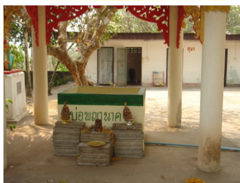
ภาพที่ ๑๐ - ๑๒ รอยพระพุทธรูปเวินกุ่ม กับบ่อพญานาค ที่เชื่อว่า มีพญานาคขึ้นมาจากแม่น้ำโขง ทางปล่องนี้ ปัจจุบันทางวัดได้ก่ออิฐล้อมรอบ เป็นรูปสี่เหลี่ยมและทำหลังคาครอบไว้ ถ่ายภาพโดย ผู้เขียน วันที่ ๒๒ มีนาคม ๒๕๕๖.