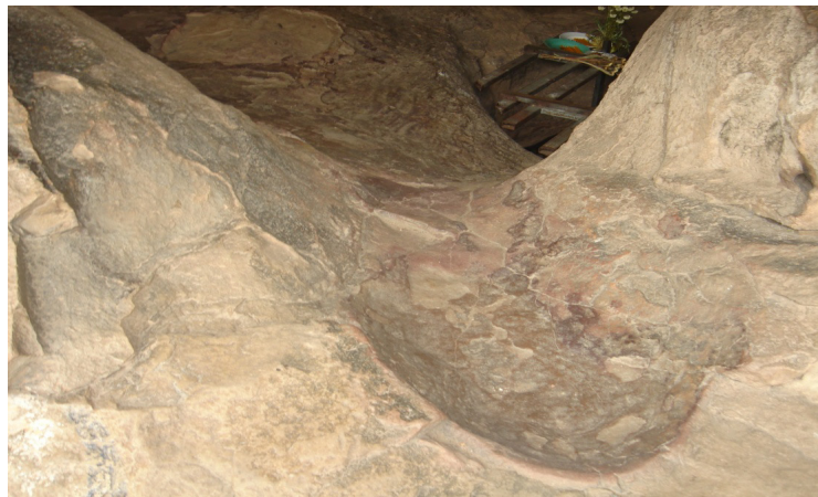
ภาพที่ ๒ - ๕ ภาพรอยพระพุทธรูป บวบก มีถ้ำและรูปพญานาคอยู่ใกล้เคียง บริเวณรอยพระพุทธรูป

วันที่ ๒๑ มีนาคม ๒๕๕๖.