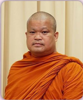
พระเมธีธรรมจารย์, รศ.ดร.