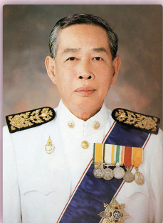
ศ.พิเศษจางันต์ ทองประเสริฐ ราชบัณฑิต