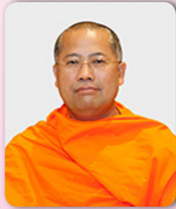
พระโสภณวชิราภรณ์