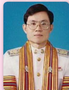
ศ.ดร.วัชระ งามจิตรเจริญ