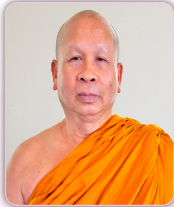
พระสุวรรณเมธาภรณ์, ผศ.