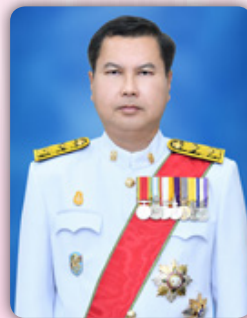
ดร.สุภัทร จำปาทอง เลขาธิการสภาการศึกษา