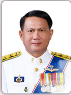
นายการุณ สกุลประดิษฐ์ ปลัดกระทรวงศึกษาธิการ