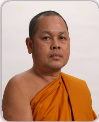
พระราชวรเมธี, รศ.ดร.