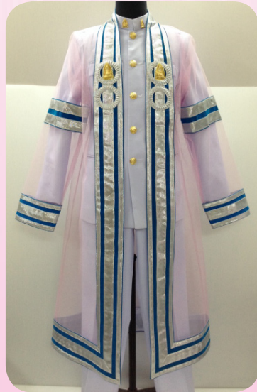
ครุยวิทยฐานะระดับมหาบัณฑิต