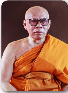
สมเด็จพระพุฒาจารย์ (สนิท ชวนปญฺโญ) เจ้าคณะใหญ่หนตะวันออก เจ้าอาวาสวัดไตรมิตรวิทยาราม