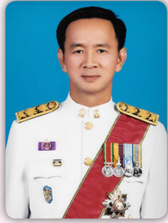
นายการุณ สกุลประดิษฐ์ ปลัดกระทรวงศึกษาธิการ