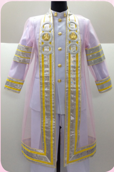
ครุยวิทยฐานะระดับคณาจารย์บัณฑิต