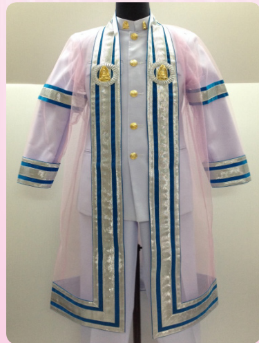
ครุยวิทยฐานะระดับบัณฑิต คณะสังคมศาสตร์