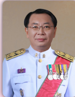
ดร.ชัยพฤกษ์ เสรีรักษ์ เลขาธิการสภาการศึกษา