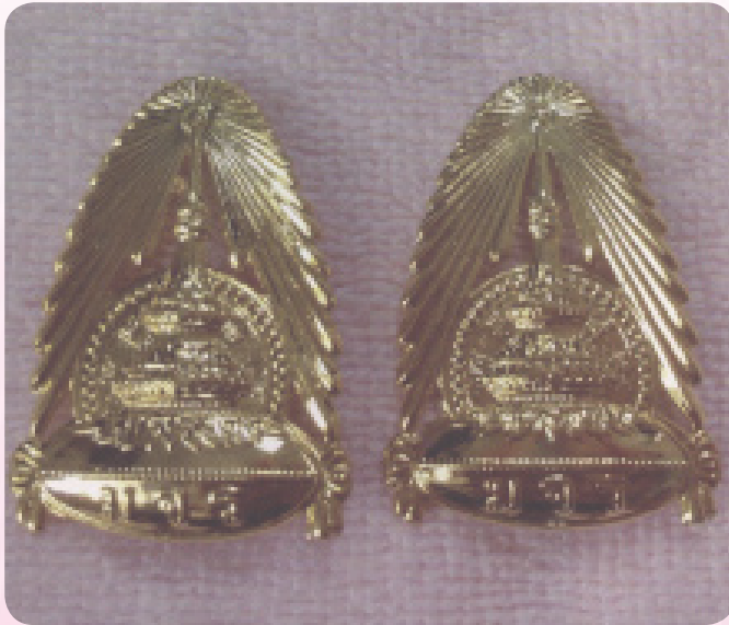
ภาพแสดงตัวอย่างเข็มวิทยฐานะ มหาวิทยาลัยมหาจุฬาลงกรณราชวิทยาลัย