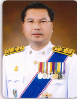
ดร.สุภัทร จำปาทอง เลขาธิการคณะกรรมการ การอุดมศึกษา