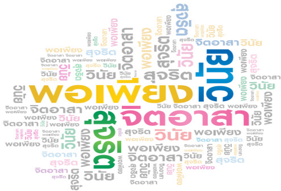
ภาพที่ ๑.๒ จิตอาสา

๒. สถาบันการศึกษา หรือองค์กร หรือสถาบันทางสังคมอื่น ๆ ควรมีบทบาทสนับสนุนและสร้างบรรยากาศให้เยาวชน หรือประชาชนเกิดการรวมตัว เพื่อการทำประโยชน์ส่วนรวม หรือการเปิดโอกาสให้ทำความดีหรือทำประโยชน์แก่ผู้อื่น หรือสังคม ให้สัมผัสปัญหาและความทุกข์เดือดร้อนของคนในสังคม เห็นความสำคัญของส่วนรวมเกิดความเห็นใจ เมตตา กรุณาและการนำไปสู่การมีจิตอาสา