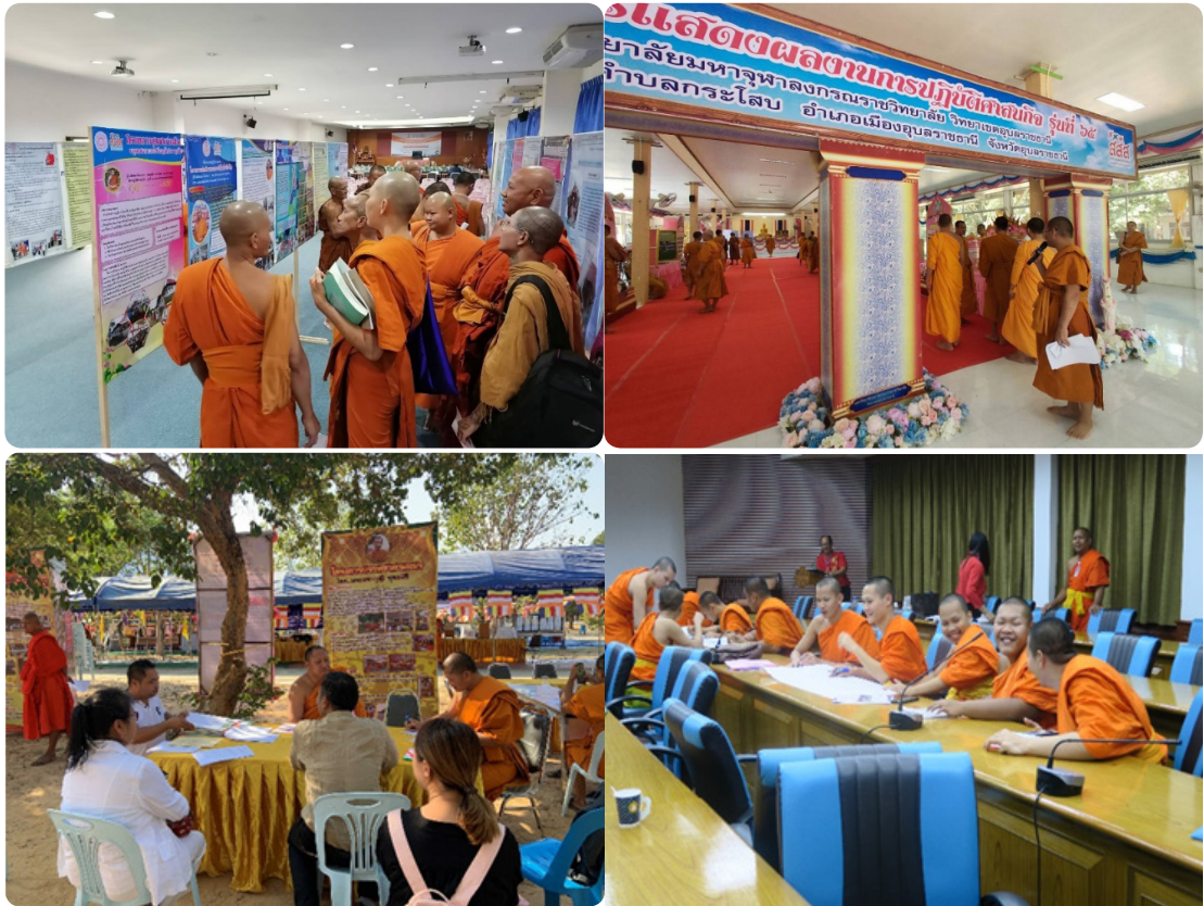
รูปภาพกิจกรรมการจัดเวทีแลกเปลี่ยนเรียนรู้ด้านการปฏิบัติศาสนกิจ

ได้เข้ามาแลกเปลี่ยนเรียนรู้ร่วมกัน ซึ่งในการนำเสนอผลการปฏิบัติศาสนกิจนั้น คณะอนุกรรมการปฏิบัติศาสนกิจจะทำหน้าที่ในการประเมินผลการปฏิบัติศาสนกิจ โดยมีเกณฑ์การประเมินโครงการปฏิบัติศาสนกิจระดับดีเยี่ยม ดีมาก ดี พอใช้ ทั้งนี้ โครงการที่ได้รับการประเมินในระดับดีเยี่ยมสูงสุดจะถูกคัดเลือกเป็นโครงการต้นแบบในพื้นที่วิทยาเขต/วิทยาลัยสงฆ์ เพื่อส่งไปประกวดและนำเสนอโครงการปฏิบัติศาสนกิจต้นแบบในระดับภูมิภาคต่อไป ซึ่งการประเมินผลนั้นจัดทำขึ้นเพื่อให้พระนิสิตได้เรียนรู้ถึงกระบวนการปฏิบัติศาสนกิจต้นแบบ พระนิสิตสามารถนำข้อเสนอแนะจากคณะกรรมการปฏิบัติศาสนกิจ/ผู้ทรงคุณวุฒิไปต่อยอดพัฒนางานเผยแผ่พระพุทธศาสนา และสร้างสังคมสุขภาวะในพื้นที่ของตนได้ในอนาคต