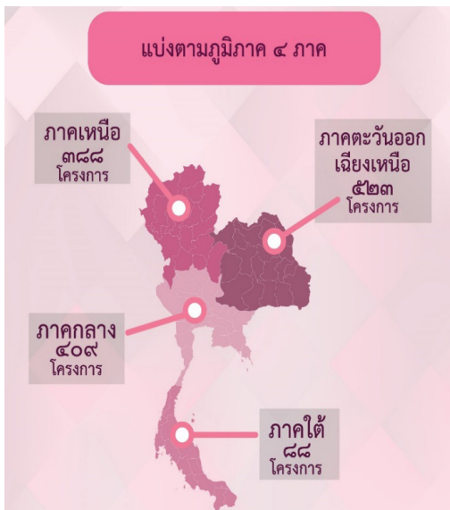
แผนภาพแสดงโครงการปฏิบัติศาสนกิจ จำแนกตามพันธกิจคณะสงฆ์

การเสริมพลังและพัฒนาศักยภาพพระนิสิตนิสิตปฏิบัติศาสนกิจในการทำงานเผยแผ่พระพุทธศาสนาเพื่อสังคม โดยคณะอนุกรรมการปฏิบัติศาสนกิจผ่านการปฏิบัติศาสนกิจของมหาวิทยาลัย มหาจุฬาลงกรณราชวิทยาลัย ได้นำไปสู่การเกิดโครงการปฏิบัติศาสนกิจที่มีความสอดคล้องและหนุนเสริมงานกิจการพระพุทธศาสนา ในพระนิสิตปฏิบัติศาสนกิจรุ่นที่ ๖๕ (ปี ๒๕๖๒) เป็นจำนวนทั้งสิ้น ๑,๔๐๘ โครงการ โดยสามารถจำแนกตามความสอดคล้องกับงานกิจการคณะสงฆ์ ๖ ด้านได้ตามแผนภาพดังนี้