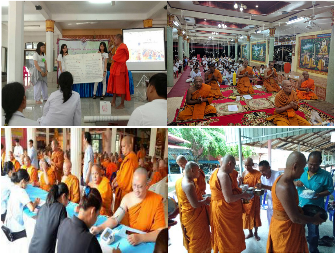
รูปภาพบางส่วนจากโครงการปฏิบัติศาสนกิจ