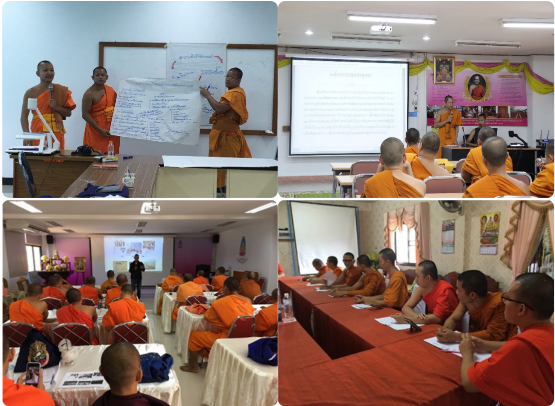
รูปภาพกิจกรรมการเสริมพลังและพัฒนาศักยภาพพระนิสิต