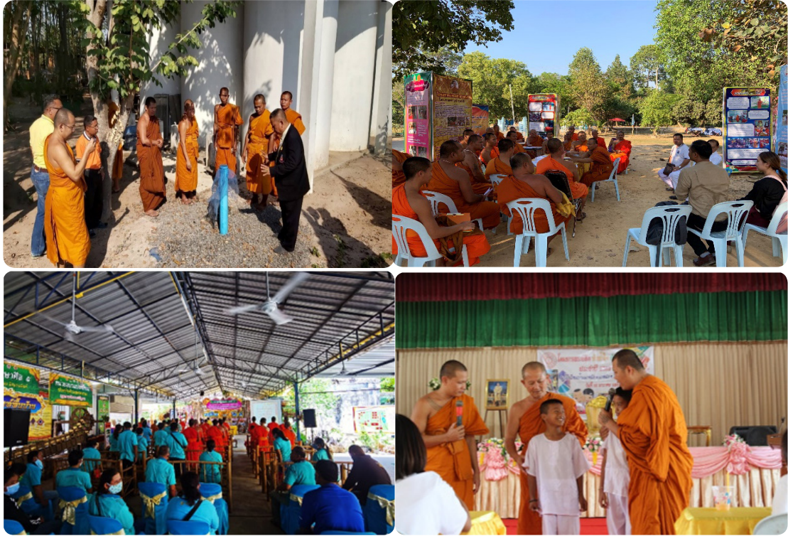
รูปภาพกิจกรรมการนิเทศ ติดตาม เสริมพลังพระนิสิตปฏิบัติศาสนกิจ

เป็นประโยชน์แก่พระนิสิตในการนำองค์ความรู้ที่ได้ไปปรับใช้ในการทำงานเผยแผ่พระพุทธศาสนา เพื่อสร้างสังคมสุขภาวะในพื้นที่ภูมิลำเนาของตนได้อย่างเป็นรูปธรรม