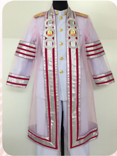
ครุยวิทยฐานะประจำตำแหน่งคณาจารย์หรือผู้บริหารวิชาการ