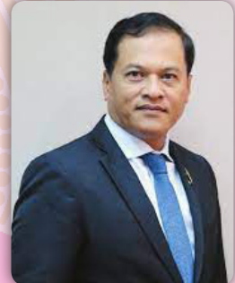
ดร.อรรถพล สังขวาสี เลขาธิการสภาการศึกษา