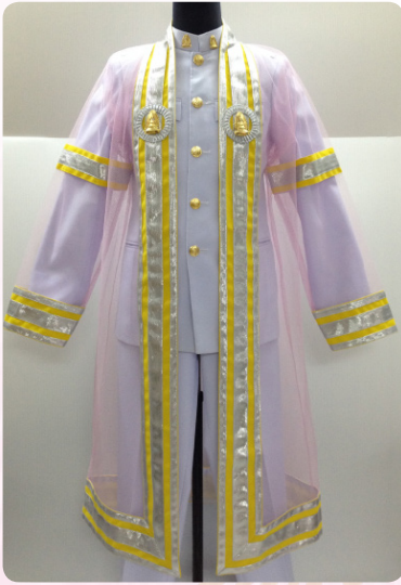
ครุยวัญฐานระดับบัณฑิต คณะพุทธศาสตร์