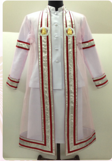
ครุยวัญฐานระดับบัณฑิต คณะครุศาสตร์