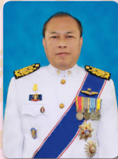
นายพิศิษฐ์ ลีลาวชิโรภาส อดีตผู้อำนวยการสำนักงาน ตรวจเงินแผ่นดิน