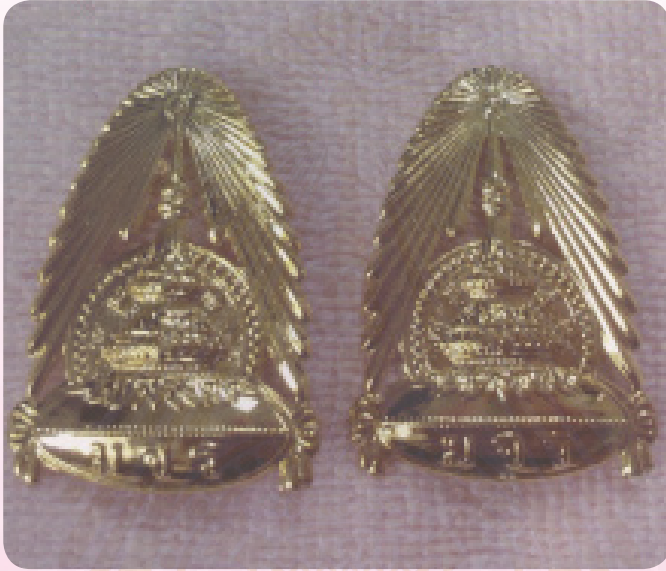
ภาพแสดงตัวอย่างเข็มวิทยฐานะ มหาวิทยาลัยมหาจุฬาลงกรณราชวิทยาลัย