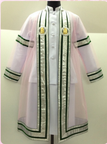
ครุยวัญฐานระดับบัณฑิต คณะมนุษยศาสตร์