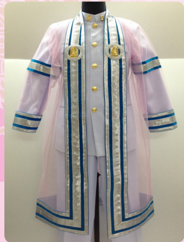
ครุยวัญฐานระดับบัณฑิต คณะสังคมศาสตร์