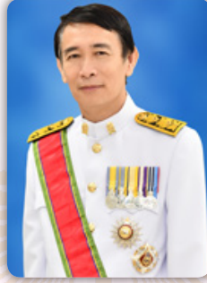
ศ.ดร.สัมพันธ์ ฤทธิเดช เลขาธิการคณะกรรมการ การอุดมศึกษา