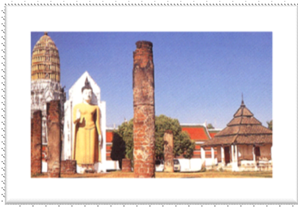
วิหารอัฐจวารส ๙ ห้อง ๑๘ เหลี่ยม วัดพระศรีรัตนมหาธาตุ พิษณุโลก

ข้อนี้ ทำไมสามารถคุ้มครองโลกทั้งโลกได้แล้วกฎหมายเป็นร้อย ๆ มาตรา ให้ความมั่นใจคุ้มครองไม่ได้ เพราะอะไร ก็แน่ละคือหิริและโอตตปะนี่ควบคุมพฤติกรรมของตนเองให้ถูกต้องตามทำนองคลองธรรมทั้งในที่ลับและที่แจ้ง ส่วนกฎหมายนั้นควบคุมพฤติกรรมคนได้เฉพาะในที่แจ้ง หรือเมื่อตนละเมิด หากละเมิดไปแล้ว ไม่มีใครพบเห็น จับไม่ได้ไล่ไม่ทัน ก็รอดความผิดนั้นไป เราพึงคิดพึงฝึกให้ตนมีคุณธรรม จริยธรรมเช่นนี้จนเป็นนิสัย ไม่ใช่ตัดจริตทำชั่วครั้งชั่วคราวตามอารมณ์เท่านั้น